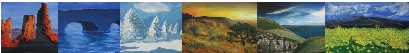
Kuvat: Taiteen kuvataiteen perusopetus: oppilastoita Hollolan ryhmästä lv 2010-2011, Maisemaeksotiikkaa